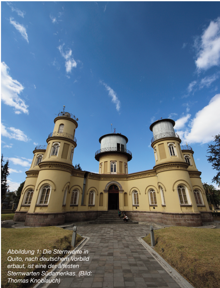
Abbildung 1: Die Sternwarte in Quito, nach deutschem Vorbild erbaut, ist eine der ältesten Sternwarten Südamerikas.

Dabei handelt es sich um lokale Abweichungen der Schwerebeschleunigung von rund \pm 0.002 \text{ m/s}^2 . Die Schwerkraftbeschleunigung beträgt auf der Erde rund g = 9.81 \text{ m/s}^2 . Auf dem Chimborazo beträgt diese jedoch 9.767 \text{ m/s}^2 . Die Gründe für diese Abweichung sind ungleiche Tiefe der Erdkruste, unterschiedliche Gesteinsdichten, Einlagerungen von Porenwasser oder Rohstoffen.